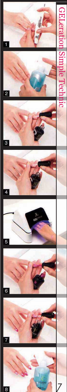
GELeration Simple Technique

http://www.este.co.jp (mail : info@irista.co.jp )